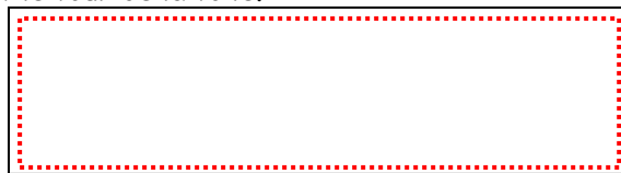
Toile à l'endroit

Etape 4 : Tracer une ligne au centre de la toile. Utiliser le mètre de couturière pour marquer des points avec le crayon et la règle bien droite pour les relier. Puis, au dessus et en dessous de cette ligne du centre, tracer deux autres lignes, chacune espacée de 8 cm.