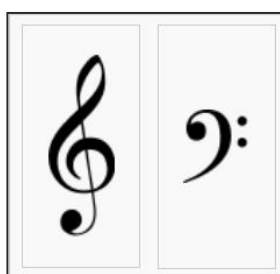
Clé de sol Clé de fa

NB : Les plus courageux(ses) fabriqueront deux portées, pour ensuite tracer à gauche avec un marker textile indélébile, la clé de sol et la clé de fa.